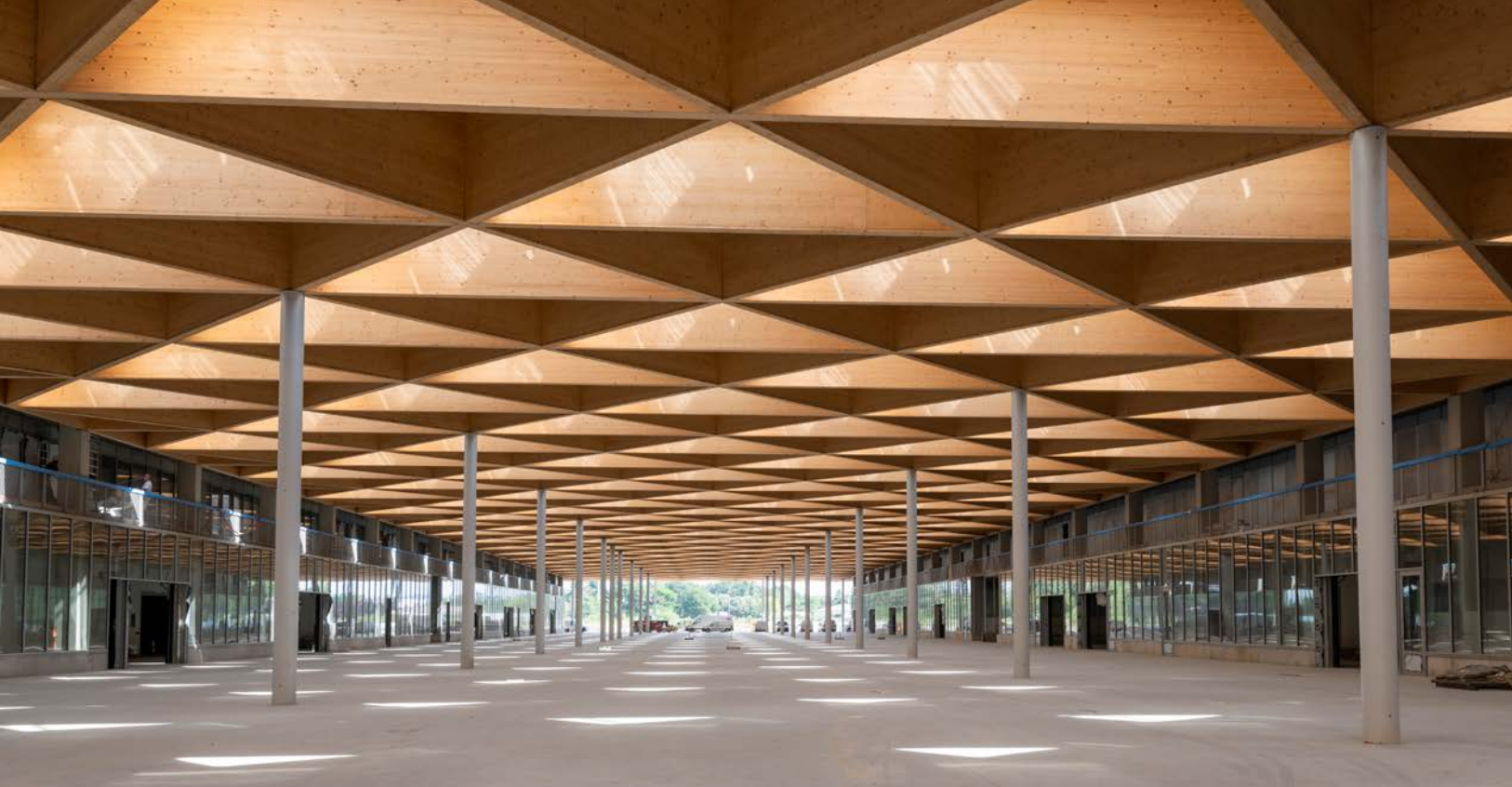
La grande halle du bâtiment A, dédiée aux fruits et légumes.